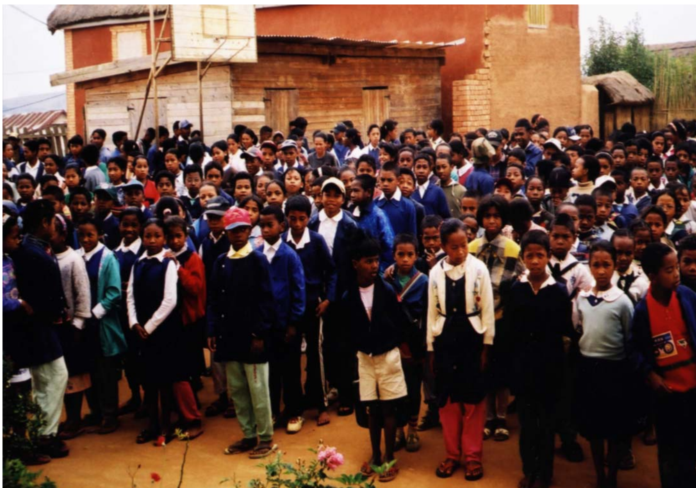
Les élèves de l'école de TALATA-VOLONDRY

POUR RÉPONDRE A TOUS CES BESOINS, NOUS AVONS ESPOIR QUE VOUS CONTINUEREZ A NOUS SOUTENIR et que d'autres nous REJOINDRONS