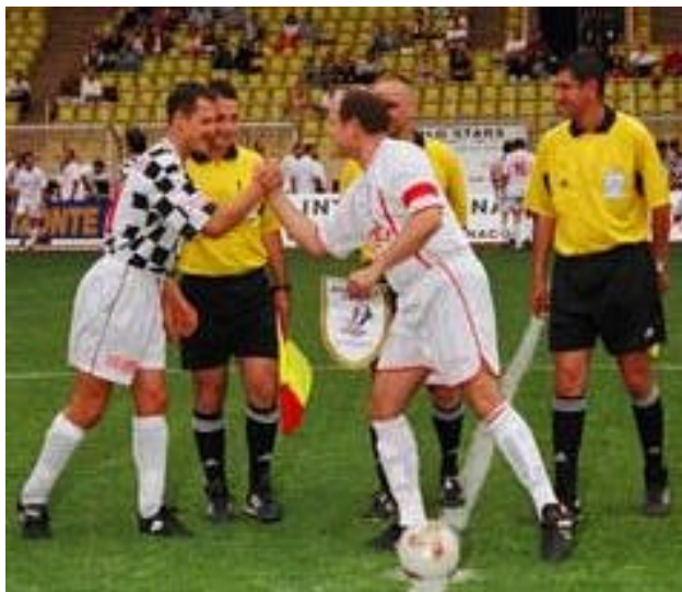
S.A.S. le PRINCE HÉRÉDITAIRE ALBERT avec Michael SCHUMACHER au cours du match du cœur

La STAR TEAM FOR CHILDREN, conduite par notre Président d'honneur, S.A.S. le PRINCE HÉRÉDITAIRE ALBERT, nous fait bénéficier des recettes du match, si sympathique qu'elle organise chaque année avec l'équipe des Pilotes de FORMULE 1 à l'occasion du Grand Prix. L'AMADE Monaco tient à renouveler ses remerciements à tous les acteurs de cette manifestation sportive ainsi qu'aux organisateurs,