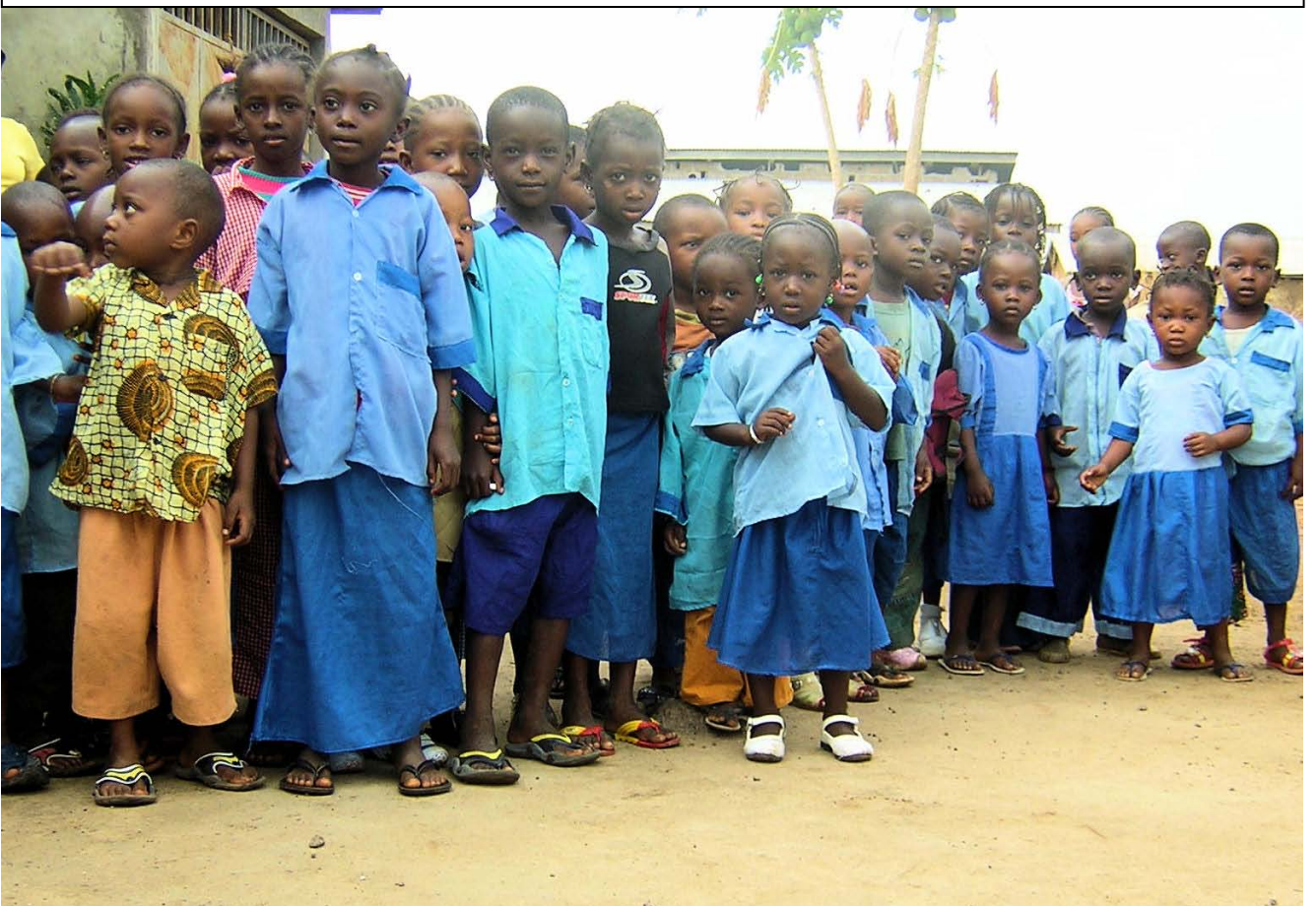
Gombayah est une banlieue des plus pauvres, à 40 Kilomètres de la capitale Conakry