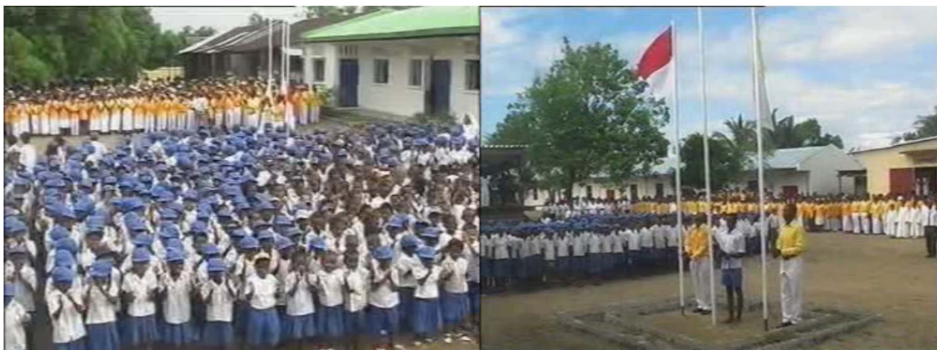
Environ 1.200 enfants fêtent les nouveaux locaux en présence des autorités locales, lors de l'inauguration

Les orphelins complètement pris en charge sont passés de 10 à 165 !